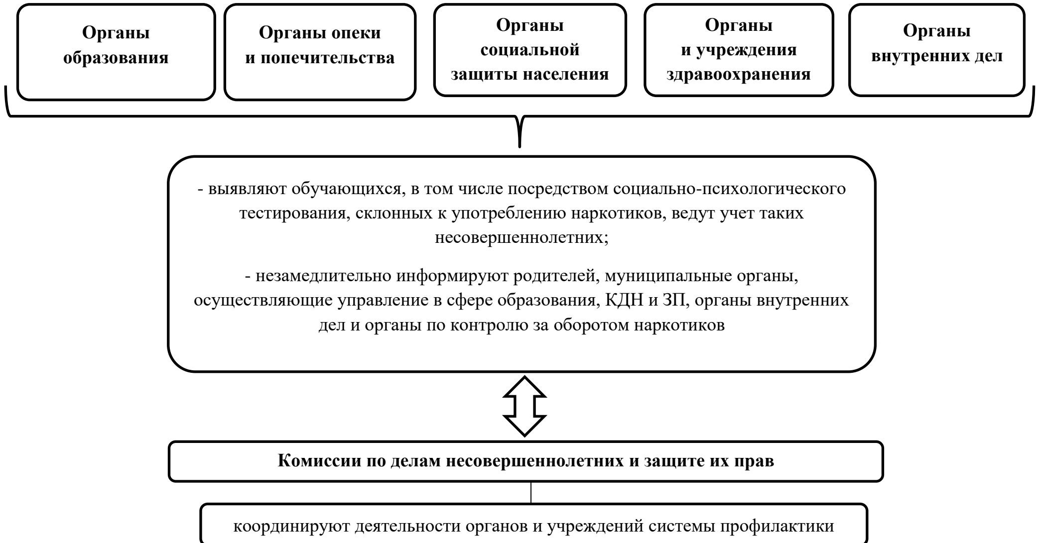
Схема 1. Выявление несовершеннолетних, употребляющих психоактивные и наркотические вещества, субъектами системы профилактики